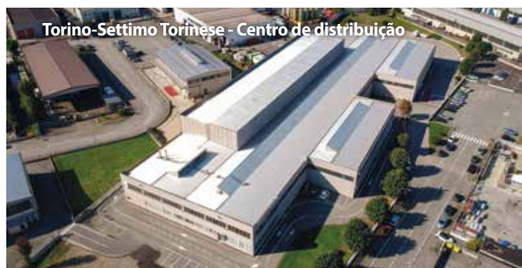
Torino-Settimo Torinese - Centro de distribuição

O armazém central é um eficiente centro logístico de 8.500 m 2 equipado com os mais modernos sistemas de armazenagem e expedição dos produtos SAIT no mundo. A disponibilidade imediata de um grande número de artigos e a gestão logística de vanguarda fazem do serviço SAIT um ponto de referência no mercado dos produtos abrasivos.