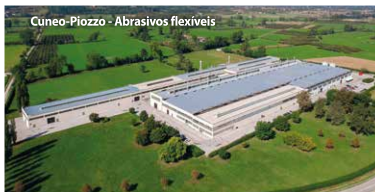
Cuneo-Piozzo - Abrasivos flexíveis

Os abrasivos flexíveis (fibra, tecido e papel) são produzidos em Cuneo-Piozzo. A fábrica foi ampliada ao longo dos anos para receber as novas linhas de produção contínua de abrasivos flexíveis. A unidade desenvolve atualmente uma superfície coberta de mais de 25.000 m 2 .