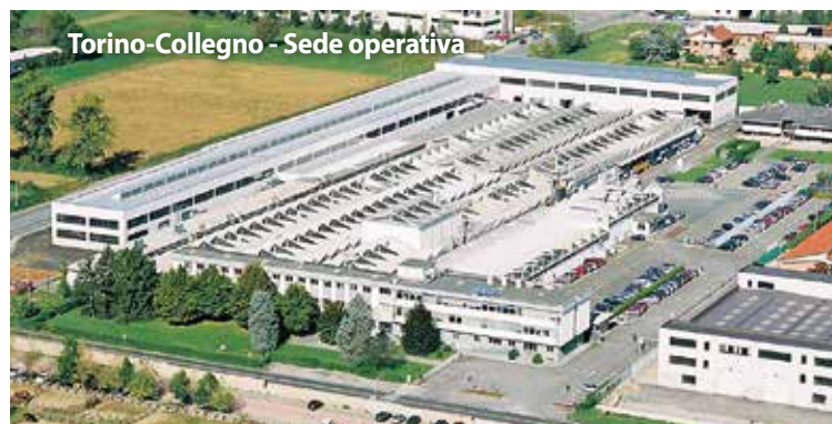
Torino-Collegno - Sede operativa

A fábrica de Turim-Collegno ocupa atualmente 27.000 m 2 e inclui a nossa sede mundial e a nossa fábrica para a produção dos discos resinóides baquelíticos reforçados para corte e para desbaste, com diâmetros de 75 a 600 mm.